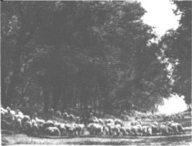
本版责编 张金康